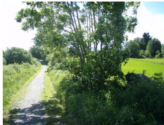
Grusstigen mot närströvområdet

ÖPPET HUS Måndagen den 2 maj 2011 kl 18-20 Församlingshemmet, Diseröd