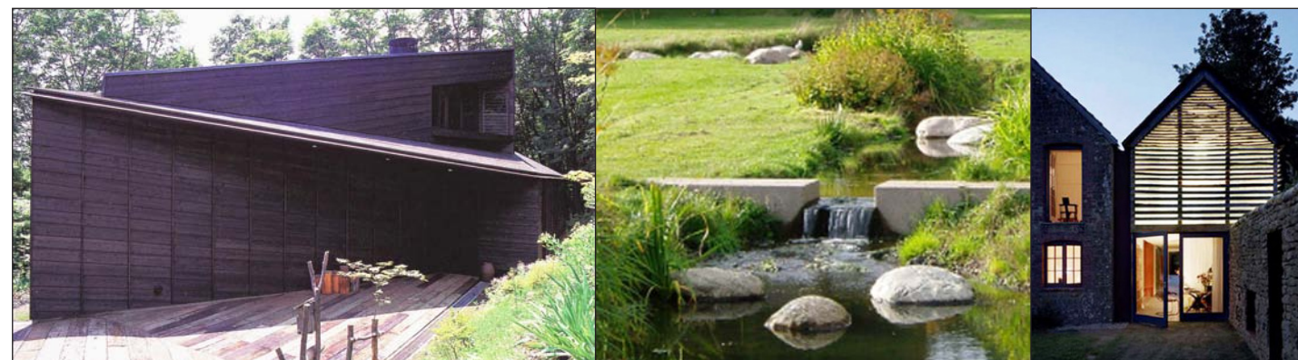
Bilder hämtade ur Book of Houses , Schleifer, 2009 och XS Green , Richardson, 2007.