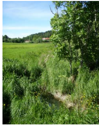
Den lilla bäcken

Synpunkter kan också lämnas på samhällsbyggnadskontoret@kungalv.se