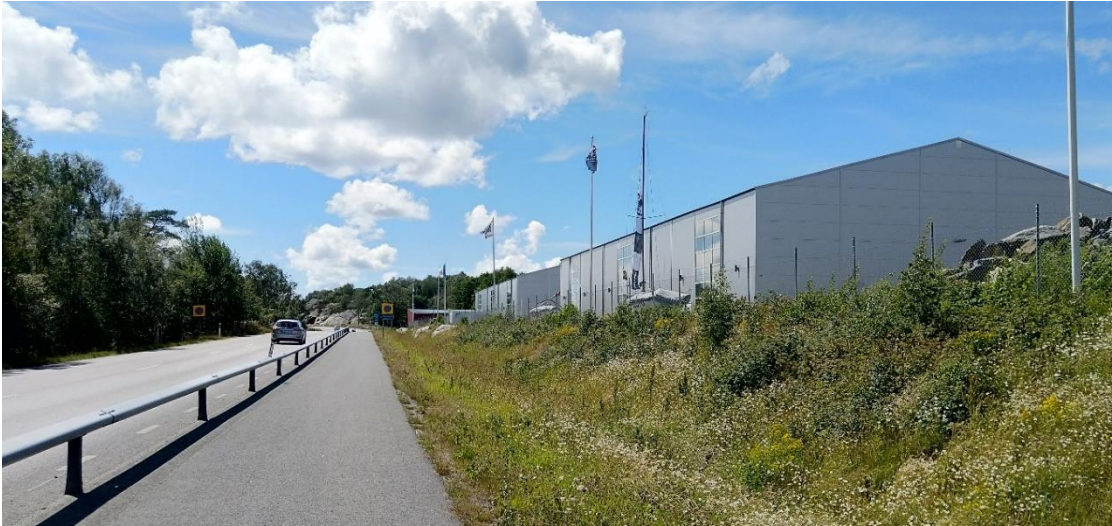
Befintliga båthallar i förhållande till väg 168 och cykelvägen