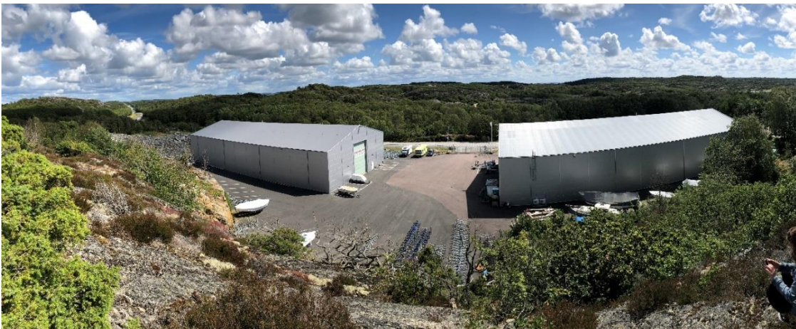
Planområdet sett från höjdryggen i norr.