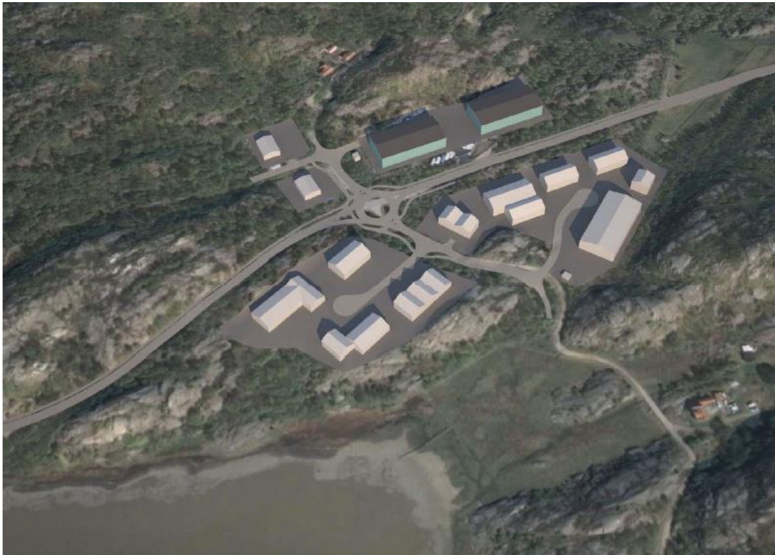
Volymkiss av möjliga framtida exploatering

Tidigare har man utrett även området söder om väg 168 för verksamhetsområde. I dagsläget är det inte aktuellt att planlägga den delen förrän kommunalt vatten- och avlopp i området är utbyggt. I samband med de framtida planerna avser Kungälv kommun även att ta med mark för och planlägga en rondell i korsningen väg 168 och Rosenlundsvägen. När större grepp med rondell görs avser även kommunen att flytta utfarten från det aktuella planområdet enligt volymkissen nedan.