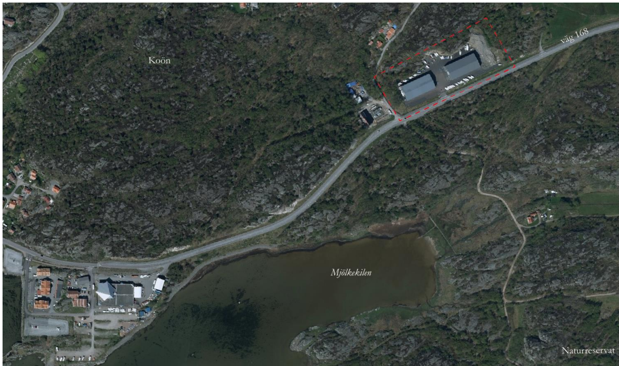
Planområdets ungefärliga läge markerat med röd streckad linje