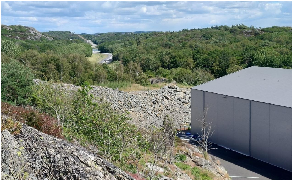
Utsikt österut - vall som uppfördes från sprängsten