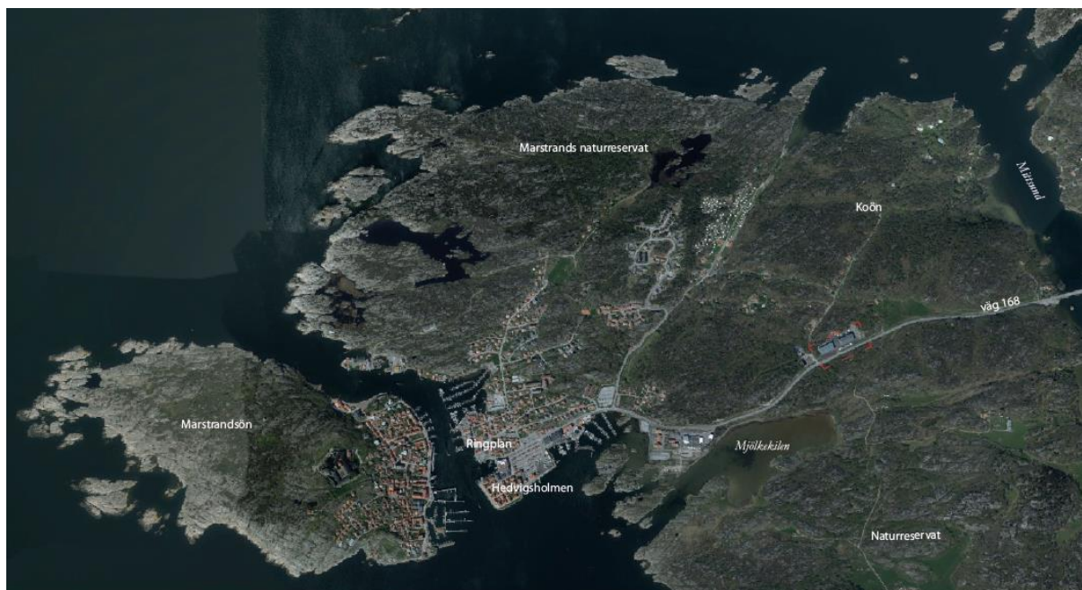
Planområdets ungefärliga läge markerat med röd streckad linje

Planområdet ligger på Koön, längs infartsvägen till Marstrand (väg 168), ca 1 500 meter öster om Ringplan, där färjan till Marstrandsön avgår.