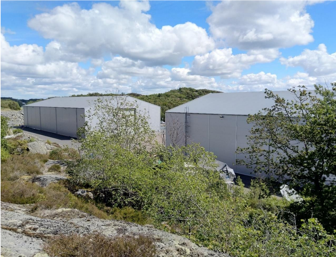
Befintliga båthallar är ca 12,5 m höga. Blicken från nordväst till sydöst.