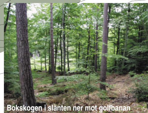
Bokskogen i slätten ner mot golfbanan

Utredningar för vatten och avlopp samt den fortsatta vägen skall göras i samband med planarbetet. Avståndet till golfbanan bör också undersökas.