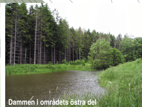
Dammen i områdets östra del