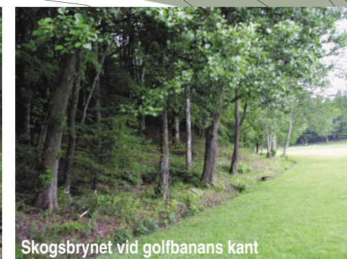
Skogsbrynet vid golfbanans kant