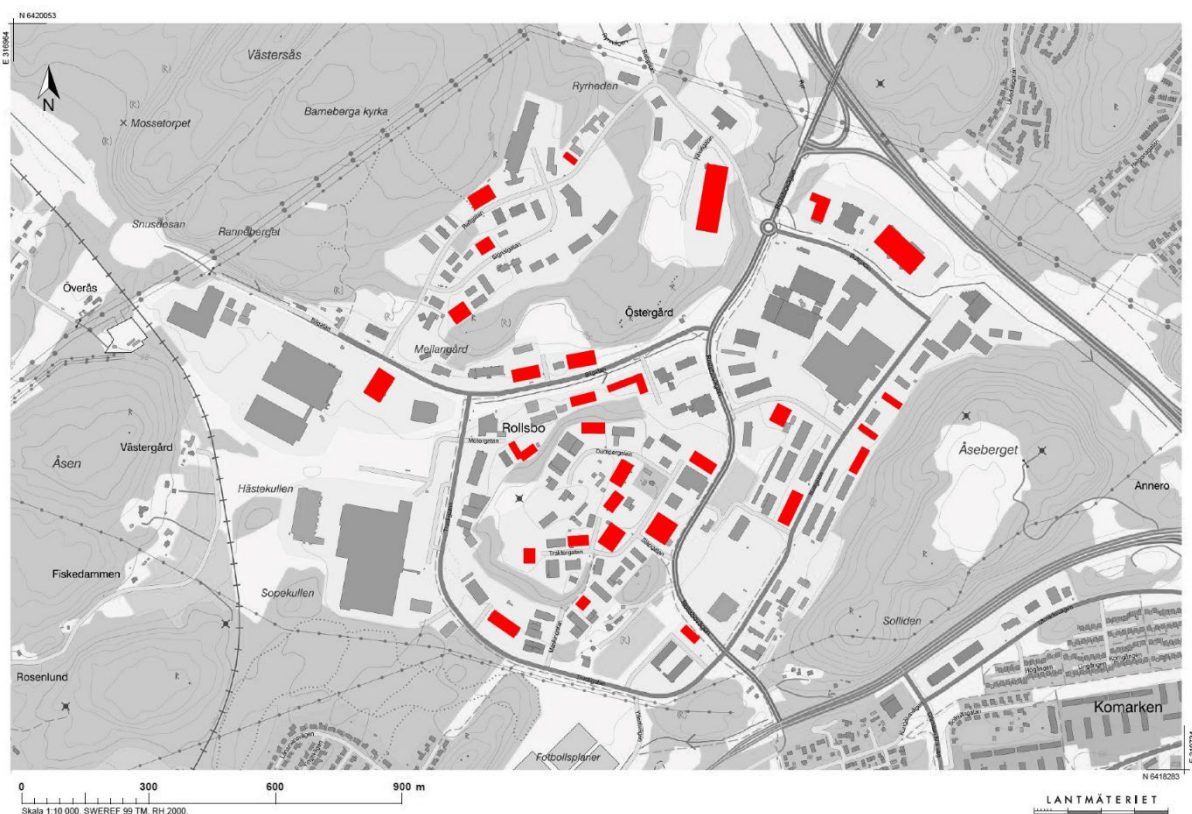
Figur 2. Karta som visar var de 40 industrier som antas ge upphov till luftutsläpp är lokaliserade inom Rollsbo industriområde. Röd markering visar industrier som bedömts ge upphov till utsläpp. Vissa byggnader huserar mer än en verksamhet vilket gör att det inte är 40 markeringar på kartan. (Lantmäteriet, 2022) Kartläggningen har därefter tagit avstamp i de 40 verksamheter som bedömts ha potentiella utsläpp av luftföroreningar i Rollsbo industriområde. Schablonutsläpp med data från Statistiska centralbyrån (SCB) 12 har använts för att beräkna industriområdets totala utsläpp. Detta innebär att de uträkningar som gjorts är kvantifierade och generaliserade för industrier i Sverige. Data från SCB visar endast utsläpp för hela Sverige men går att precisera per sektor. Egna mätningar på platsen har ej genomförts vilket bör beaktas i bedömningen. Bedömningen av luftpåverkan från Rollsbo industriområde har därefter genomförts utifrån rådande miljö kvalitetsnormer för luft.

De industrier som finns i Rollsbo är främst verkstäder av olika slag. I SCB:s databas har industrier baserat på näringsgren SNI 2007 valts 13 . SNI 2007 är ett begrepp som betyder ”Standard för svensk näringsgrensindelning” (SNI). Detta används som en klassifikation för att definiera verksamheter och för att föra statistik gällande ekonomiska aktiviteter för företag och arbetstillfällen 14 .