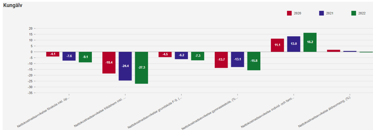
Diagram 2. Nettokostnadsavvikelse 2020 - 2022. Nettokostnadsavvikelsen jämför nettokostnaden med referenskostnaden ("statistiskt förväntad" kostnad). Resultat över 0 indikerar högt kostnadsläge, pga hög ambitionsnivå och/eller låg effektivitet.

omställning av arbetsmetoder ske. 1 Fokus fram till år 2027 är att utjämna de kostnader som ligger över genomsnittet. Kungälv kommun ska inom samtliga områden kunna jämföras med kostnadseffektiva och jämförbara kommuner.